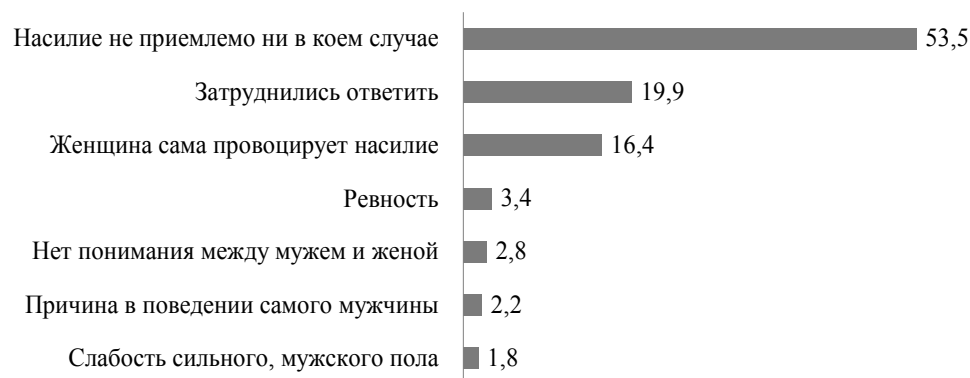
Рис. 2. Мнения респондентов о случаях допустимости насилия в отношении женщин, % (N = 2000)

Согласно полученным ответам, для большинства респондентов (53,5 %) насилие не приемлемо ни в каком случае и ни при каких условиях. В то же время 16,2 % опрошенных считают, что женщина сама провоцирует насилие в отношении ее, 2,2 % видят причину в поведении мужчин. С ответом затруднились 19,9 %. 3,4 % опрошенных назвали ревность в числе основных причин насилия. Некоторая часть респондентов (1,8 %) рассматривают насилие как способ самоутверждения сильного, мужского пола (рис. 2). В ответах 0,2 % опрошенных насилие оправдывается религией: «У мусульман это должно быть, жена подчиняется мужу». Вариант ответа «Нет понимания между мужем и женой» составил 2,8 % [там же: 126].